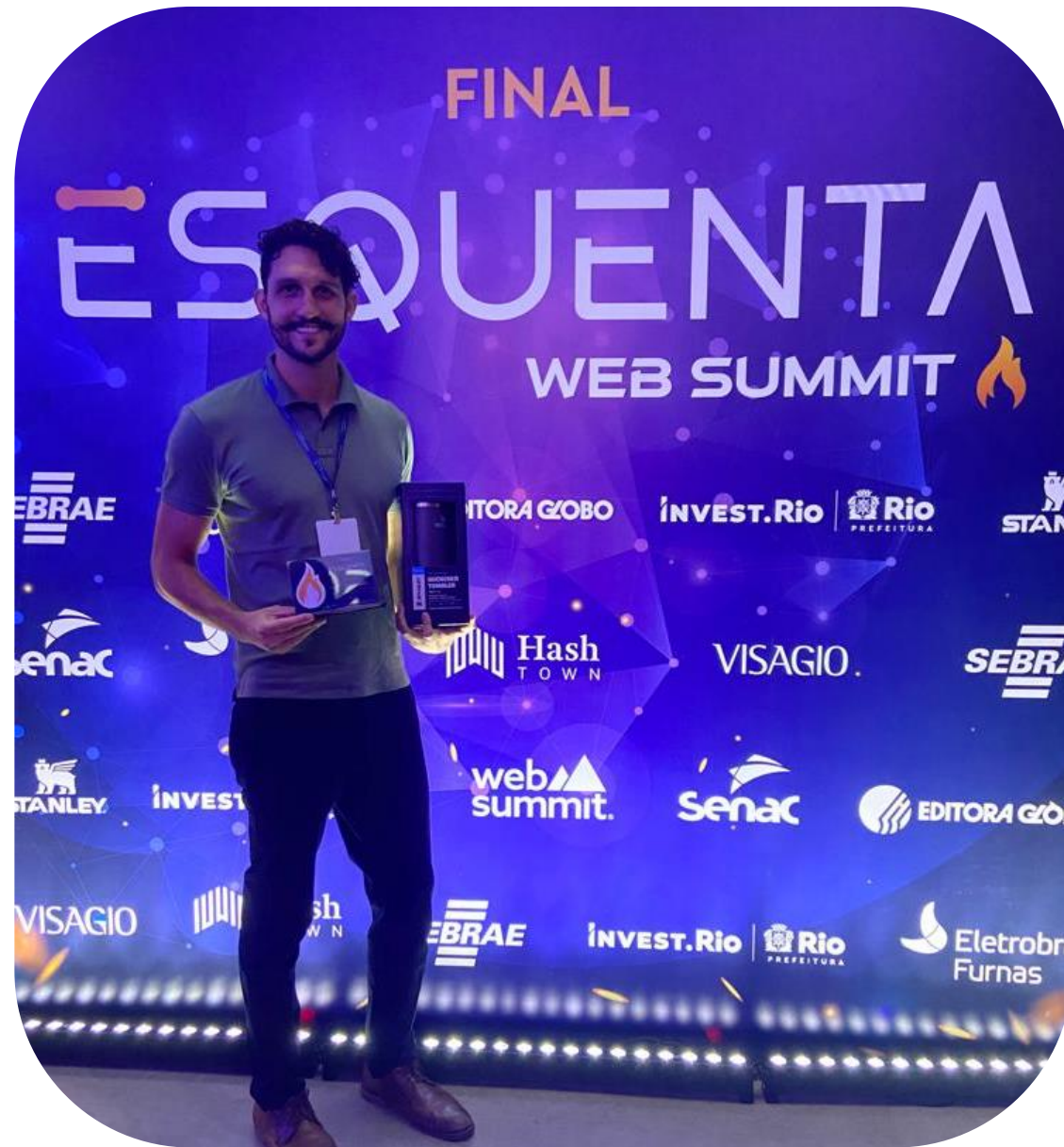
Batalha de Startups WebSummit