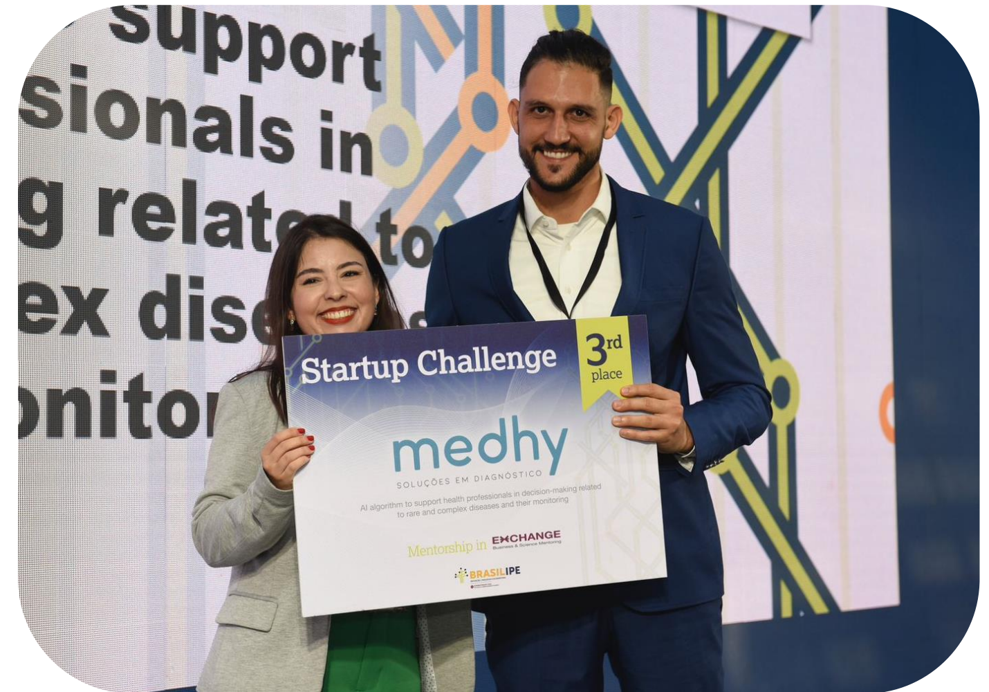
Hackaton Astrazeneca IPT/USP